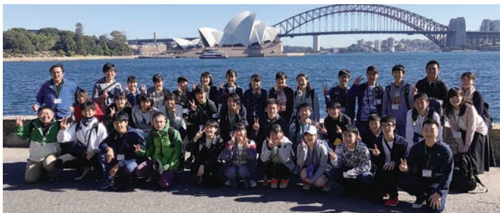
▲ミセス・マッコリーズ・ポイントから

◆ 英語はもちろんのこと、オーストラリアの文化、そして人々の優しさ、おにぎり大使を通して普通では体験できない貴重な体験をたくさんできました。 ◆ 今回の活動で学んだことは、自分の意見をしっかりと持ち、相手に伝えようとする意志をしっかりと持つことが大切だと思いました。 ◆ 普段は日本の文化しか触れていませんが、オーストラリアとの文化の違いを知って、海外の文化への見方が大きく変わり、お互いの良い所を認め合うことができました。