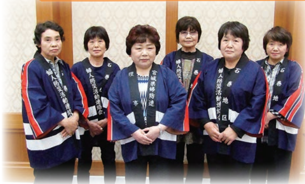
▲石巻地区婦人防災活動連絡会 役員のみなさん