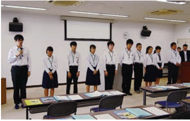
▲結団式での自己紹介

初対面で緊張した表情の中、一人一人が自分の目標達成に向けて決意を新たにしていました。