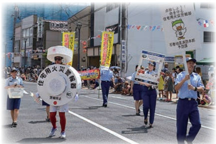
▲第96回石巻川開きパレードの様子